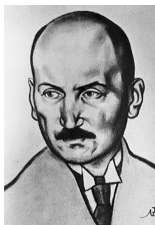
Nikolai Triik. Oskar Lutsu portree. 1928

Lisades olevad tabelid, joonised, fotod ja reproduktsioonid pealkirjastatakse või allkirjastatakse nii nagu töös põhiosas. Vaata järgnevat näidet: teose autor, pealkiri, loomisaeg.