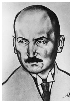
Nikolai Triik. Oskar Lutsu portree. 1928

Lisades olevad tabelid, joonised, fotod ja reproduktsioonid pealkirjastatakse või allkirjastatakse nii nagu töös põhiosas. Vaata järgnevat näidet: teose autor, pealkiri, loomisaeg.