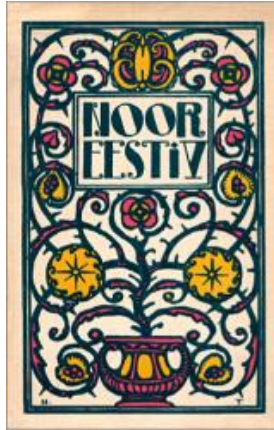
Joonis 2.3. Noor-Eesti V albumi kaas. 1915