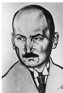
Nikolai Triik. Oskar Lutsu portree. 1928