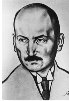
Nikolai Triik. Oskar Lutsu portree. 1928